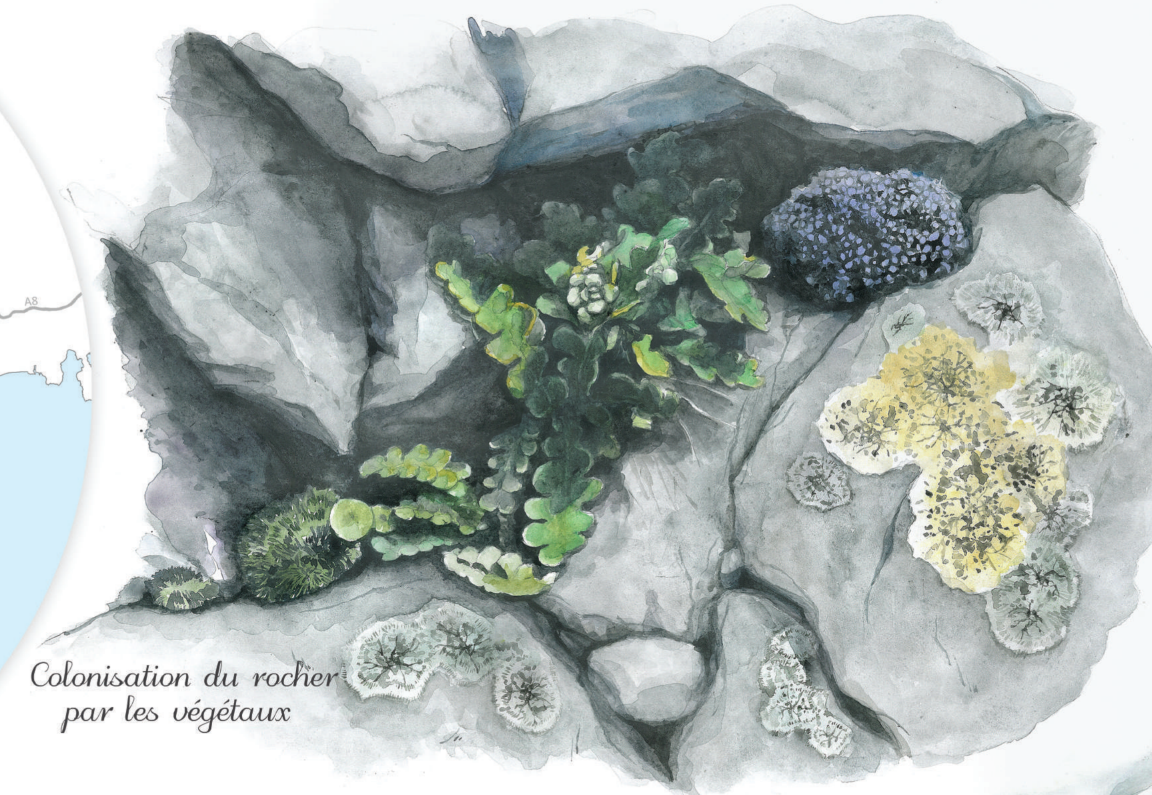
Colonisation du rocher par les végétaux

La Communauté d'Agglomération Sophia Antipolis est animatrice de trois sites Natura 2000 terrestres : « Préalpes de Grasse », « Rivière et Gorges du Loup » et « Dôme de Biot ». Son rôle est de veiller à la conciliation des activités avec la préservation du patrimoine naturel.