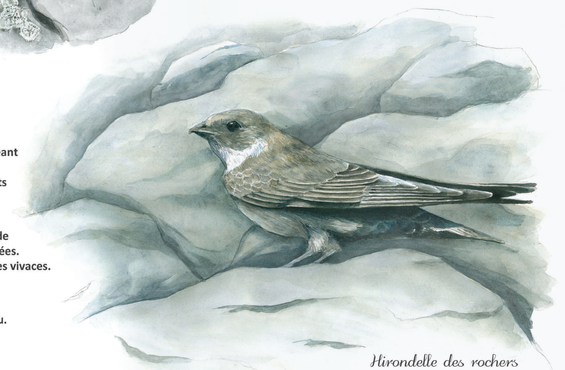
Hirondelle des rochers